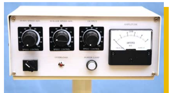
Panneau de commande très accessible

Une caractéristique spécifique de la BelSonic SeamStar BS 2010r est la soudure de films adhésifs entre deux couches de tissu non-thermoplastique. Cette spécificité permet une soudure parfaite même avec de la cellulose ou d'autres tissus non-synthétiques.