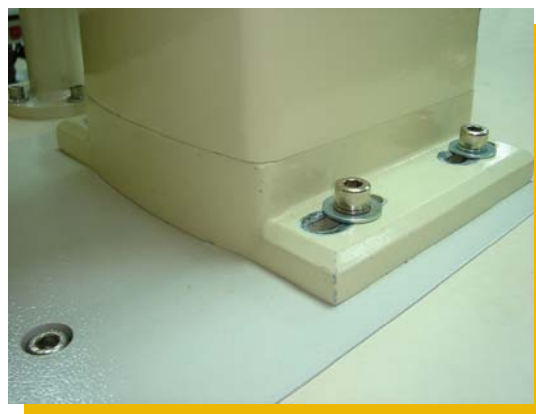
déplacement gauche / droite du col de cygne

La soudure par ultrasons est effectuée en faisant passer des vibrations de haute-fréquence sur la toile. Lorsque le tissu synthétique ou le non-tissé passe entre la sonotrode et la molette de la machine à souder par ultrasons, ces vibrations sont dirigées vers le tissu où elles créent un échauffement rapide de la température. Cette chaleur fait fondre les fibres synthétiques de la matière, qui se soudent produisant ainsi des coutures soudées qui ne s'effiloquent pas et forment une barrière complète